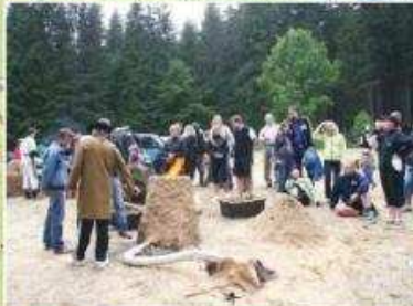
I: experimentální tavba železa v roce 2009