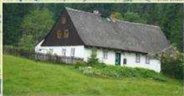
Tradiční chalupa v Mníchově