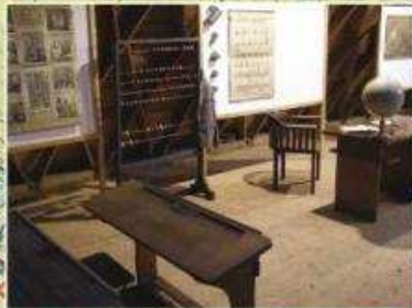
Malá Morávka: Schindlerova školka - expozice stará škola