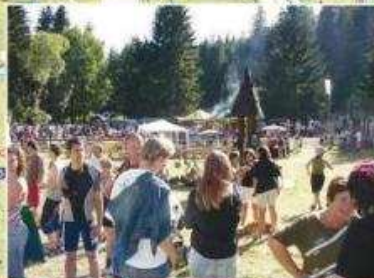
Vrčno p/P: Lesní slavnost Lapků z Drakova